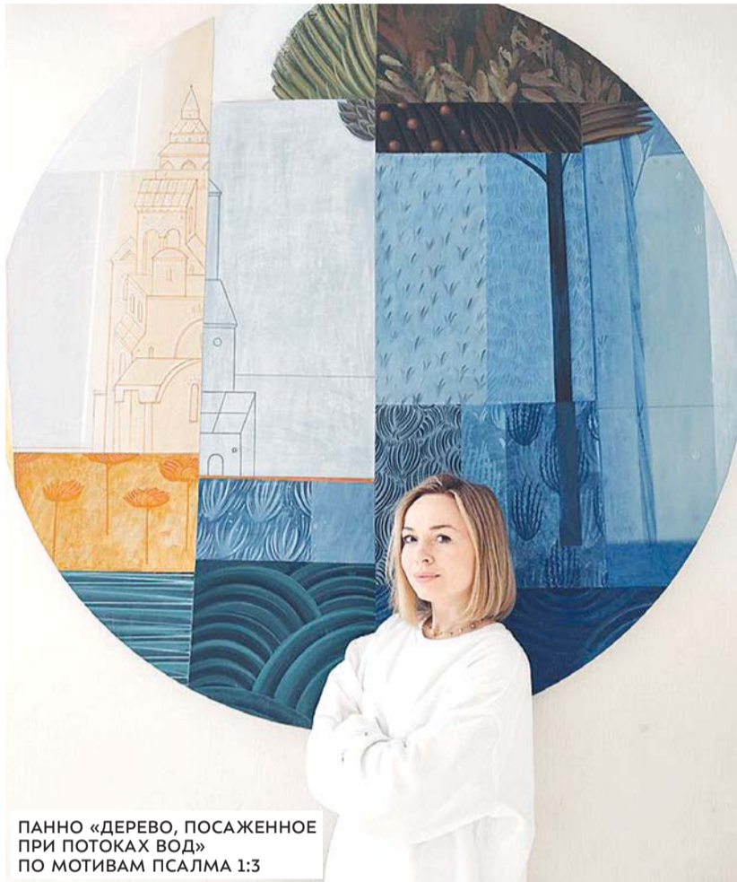
ПАННО «ДЕРЕВО, ПОСАЖЕННОЕ ПРИ ПОТОКАХ ВОД» ПО МОТИВАМ ПСАЛМА 1:3