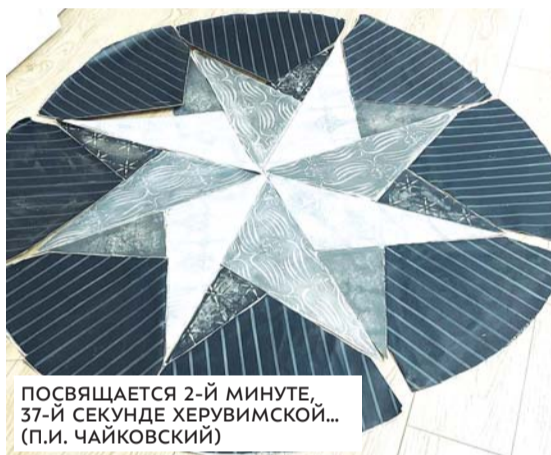
ПОСВЯЩАЕТСЯ 2-Й МИНУТЕ, 37-Й СЕКУНДЕ ХЕРУВИМСКОЙ... (П.И. ЧАЙКОВСКИЙ)